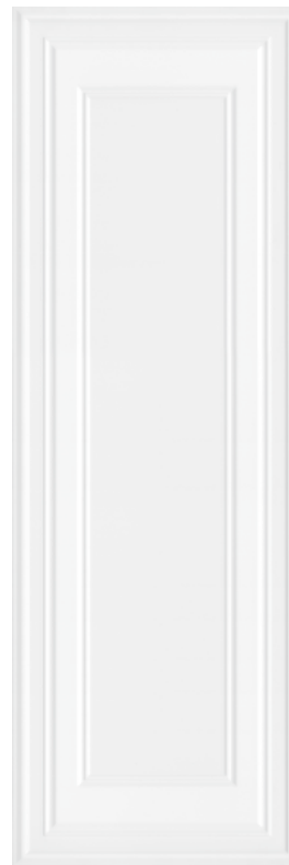
14008R Монфорте белый панель обрезной 40x120 Monforte white panel rectified