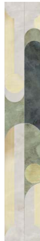
VTG128\31008R Джардини обрезной 20x120 Giardini rectified