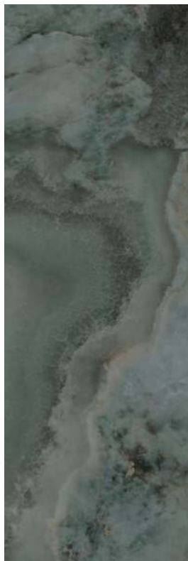
14024R Джардини серый тёмный обрезной 40x120 Giardini dark grey rectified