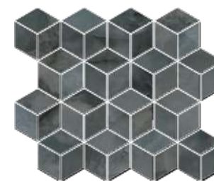
T017\14024 Джардини серый тёмный мозаичный 40x37,5 Giardini dark grey mosaic