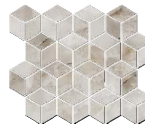
T017\14023 Джардини беж светлый мозаичный 40x37,5 Giardini light beige mosaic