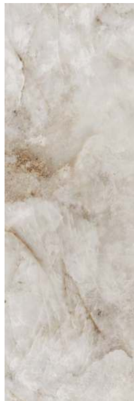
14023R Джардини беж светлый обрезной 40x120 Giardini light beige rectified