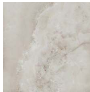
SG642202R Джардини беж светлый обрезной лаппатированный 60x60 Giardini light beige rectified lappato