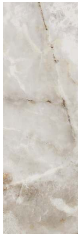
14023R Джардини беж светлый обрезной 40x120 Giardini light beige rectified