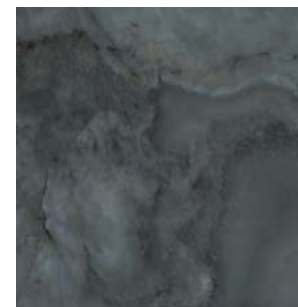
SG642402R Джардини серый тёмный обрезной лаппатированный 60x60 Giardini dark grey rectified lappato