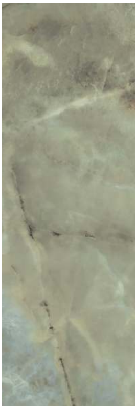
14025R Джардини зелёный обрезной 40x120 Giardini green rectified