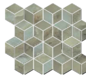
T017\14025 Джардини зелёный мозаичный 40x37,5 Giardini green mosaic