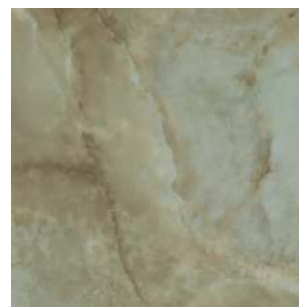
SG642302R Джардини зелёный обрезной лаппатированный 60x60 Giardini green rectified lappato